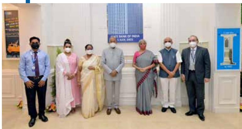
राष्ट्रपति इस्टेट शाखा, नई दिल्ली का उद्घाटन

फिर से शुरू करने से गति प्राप्त करने में मदद मिली है। बैंकिंग प्रणाली द्वारा दिए गए जोर ने गृह ऋण/आवासीय अचल संपत्ति में वृद्धि को बढ़ावा देने में मदद की है।